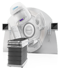
Accelerator liniar cu gantry convențional