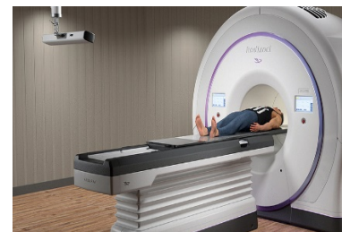
Accelerator pentru tomoterapie